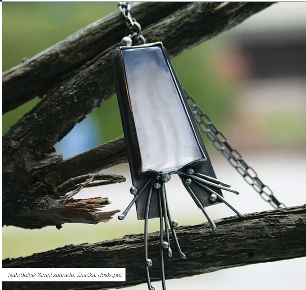
Náhrdelník Zimní zahrada. Značka: doskopet