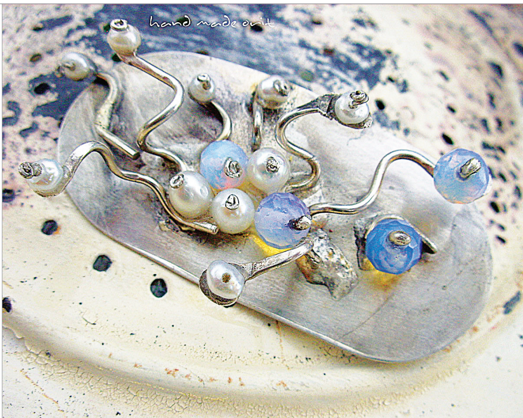
Brož Roztančená Sasanka. Značka: Orit

To se týká nejen mycích prostředků, ale například i veřejných bazénů a vířivek, kde se pro likvidaci bakterií používá chlór. Ten může při častějším kontaktu povrch šperku naleptat a mnoho drahých kamenů účinkem této látky bledne.